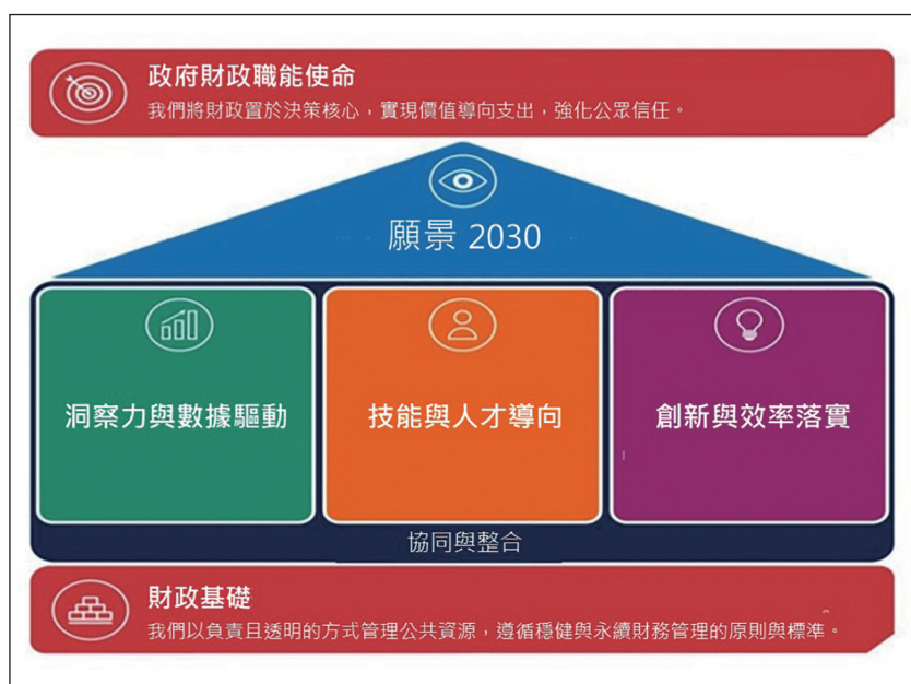
圖 2 英國 2025 年最新版政府財政職能策略