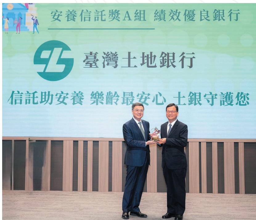
圖 2 臺灣土地銀行股份有限公司連 3 屆榮獲信託 2.0 計畫評鑑為安養信託績效優良銀行