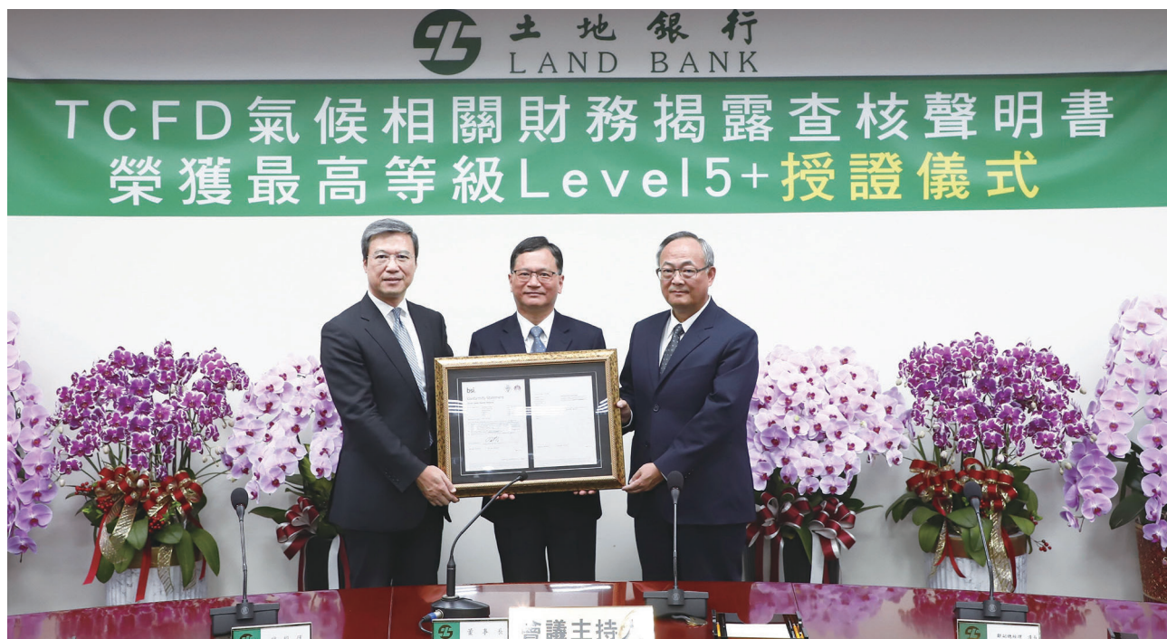
圖 1 臺灣土地銀行股份有限公司 TCFD 榮獲 BSI 最高等級認證「Level 5 +」授證儀式

此外，土銀亦籌組「ESG 小組讀書會」，讀書會題材以當前國內最新相關法規政策為主，輔以國外淨零法案及企業案例，並安排相關教育訓練講座，俾利讀書會同仁確實掌握