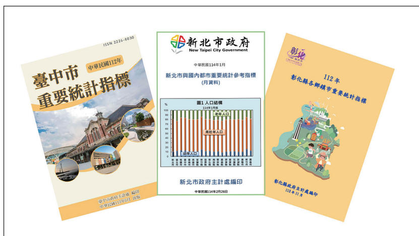
圖 3 地方政府研編統計指標成果

國內近年來由學者及報章媒體所建立之縣市競爭力評比不勝枚舉，許多地方政府參酌天下雜誌、遠見雜誌、經濟日報及今周刊等常用之客觀指標，先行彙管統計指標，並就各指標進行縣市排名及分析，同時強化內審機