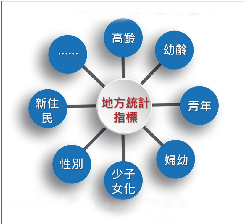
圖 4 地方政府建置之特定族群指標主題

我國地方統計資料之彙集，已在完善的公務統計制度下運作，除完備中央部會與地方基礎資料之連結，亦依照地方之特色及施政需求，自訂公務統計報表，納入公務統計方案定期編製，穩定蒐集並觀察變化趨勢，以反映社經發展脈絡及檢視施政成效，以達數據管理。未來須更精進各項經社指標之廣度、深度、確度與時效，提供政府施政及各界參用。❖