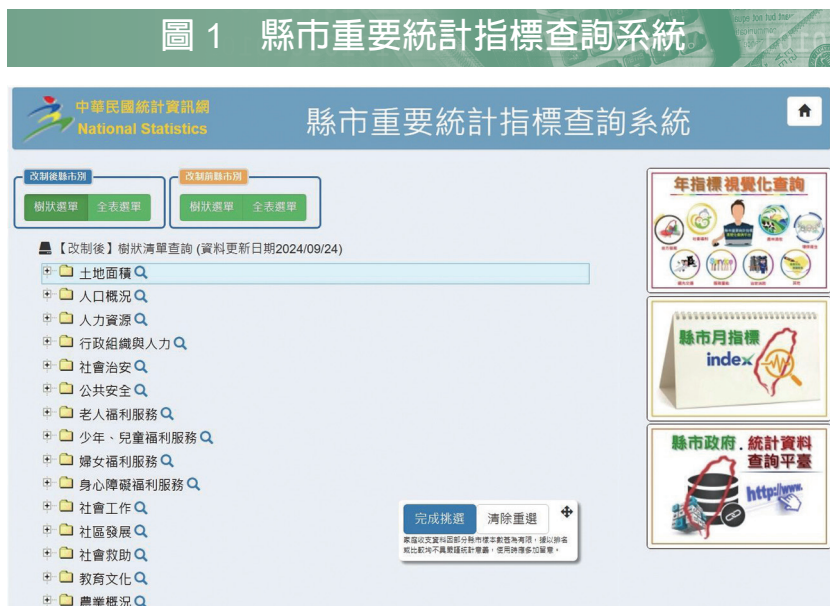
圖1 縣市重要統計指標查詢系統

資料來源涵括內政部、財政部、交通部、經濟部、農業部、環境部、衛生福利部等14個部會，大多數資料係各權管部會依公務統計制度透過各地方政府彙集而成。