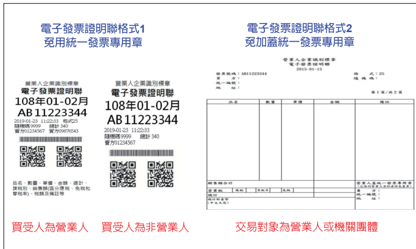
圖 2 電子發票證明聯格式

同仁得以廠商提供之電子發票開立通知或開立資訊（須註明交易明細）等作為其他可資證明文件，或透過智慧型手機應用程式查詢該筆交易明細並列印，依憑證要點第 12 點規定註明無法取得原本之原因辦理結報。又機關同仁出差住宿如透過境外電商網站訂房（如 Agoda 網站），因上開境外電商開立之電子發票屬雲端發票，未有電子發票證明聯，同仁亦可