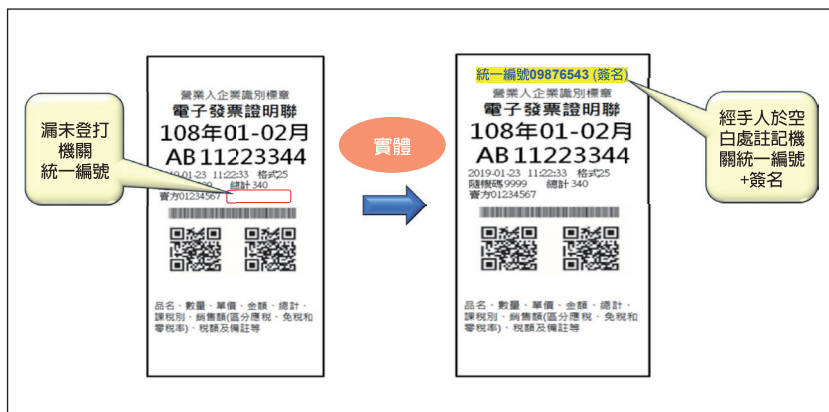
圖 3 取得電子發票證明聯