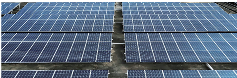
圖 1 臺灣菸酒股份有限公司太陽光電設施

在酒品製程中產生酒粕、酵母等釀酒副產品，透過核心發酵及菌種培育技術，重新開發製成食品類產品，另將釀酒過程中產生副產品，轉售予台灣肥料股份有限公司及農畜產業做為有機肥料及飼料之用，創造 99% 以上之原物料回收利用率，菸酒公司透過下腳料再應用，2023 年成功增加逾 1,633 萬元經濟效益。