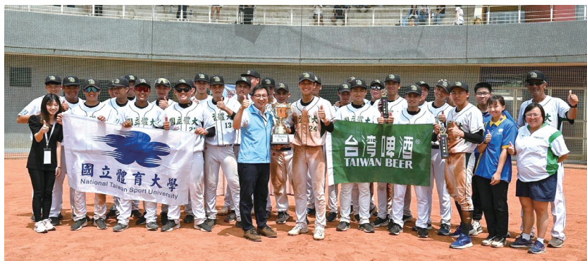
圖 3 台啤棒球隊