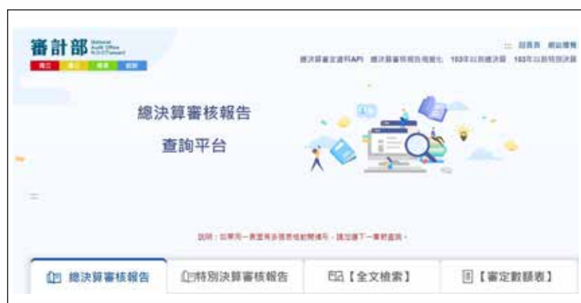
圖 2 總決算審核報告查詢平台

（圖 2），使用者可透過平台依需求直觀查閱審核報告揭露之政府財政資訊、施政計畫執行情形及審計部審核結果，檢視各冊審核報告章節，依循平台列示之審核意見標題查閱公務機關、國營事業、非營業特種基金等有關重要審核意見，亦可運用全文檢索功能，以年度、政府別、檢索範圍、搜尋關鍵字等檢索所需資訊，協助平台使用者依需求迅速掌握閱覽審核報告報導內容。另配合國際減碳趨勢及政府無紙化措施，自審編 112 年度中央政府總決算、附屬單位決算及綜計表審核報告起，原列於總決算審核報告（第 1 冊）之「戊、