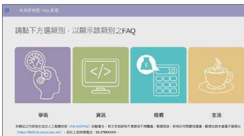
圖 3 中研院 FAQ 網頁專區分類