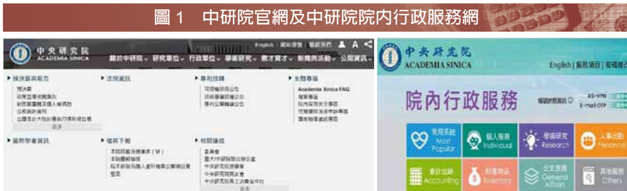
圖 1 中研院官網及中研院院內行政服務網

中研院在 2023 年 2 月 19 日由資訊處啟動 AIG-FAQ 專案計畫，邀集主計室、學術處、秘書處等行政單位共同組成專案團隊研討，蒐集相關規定，先透過 OpenAI API 讓 ChatGPT 依據輸入的相關規定，扮演院內使用者的角色進行提問，接著再由 ChatGPT 依據原本輸入的相關規定，回答所蒐集到的問題，最後再透過 Python 語言將整套流程自動化產生 FAQ，並自動翻譯成多國