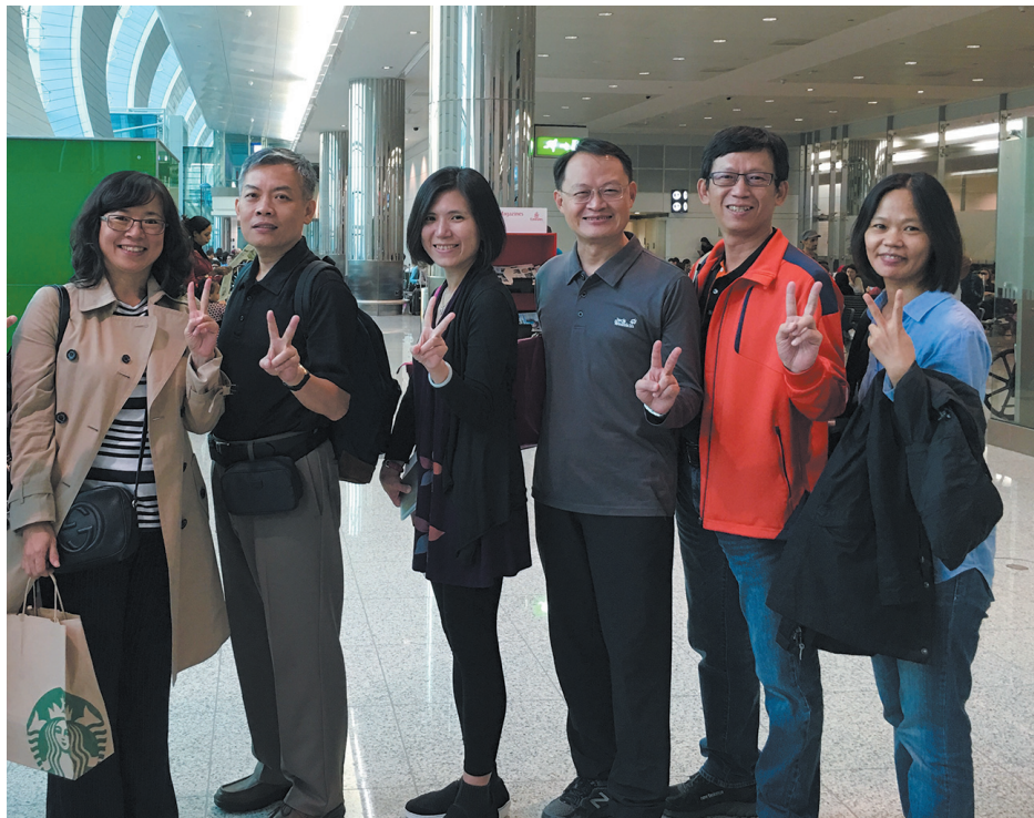
● 作者群攝於杜拜機場

決方案與可能影響〉, http://homepage.ntu.edu.tw/~nankuang/Money%20and%20Banking%20Supplement/10/%E6%84%9B%E7%88%BE%E8%98%AD%E5%87%BA%E4%BA%86%E4%BB%80%E9%BA%BC%E5%95%8F%E9%A1%8C.pdf 。 4. 財政主計金融處, 2016, 〈財政部「104 年度所得稅結算申報辦理情形」〉, http://www.ey.gov.tw/News_Content.aspx?n=4E506D8D07B5A38D&sms=16018955FD908208&s=DE1D41EA2D755B30 。❖