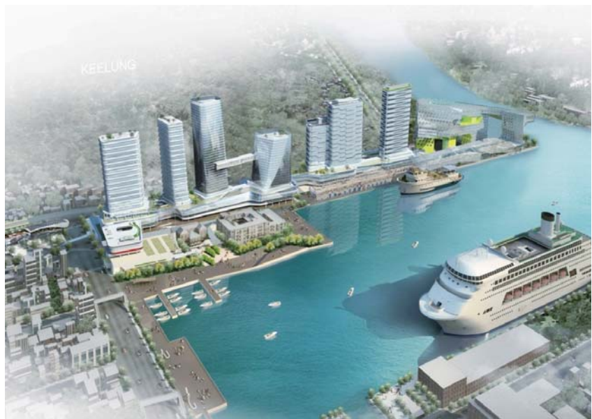
● 發展定位：商旅新都心

結合基隆豐富城市生活與海洋資源，透過本案掌握轉型契機，發揮港灣特色，重塑北臺灣海洋門戶意向，帶動觀光產業發展創造就業機會。