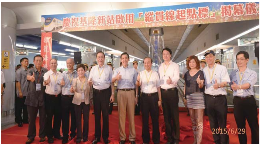
● 基隆車站啟用縱貫線起點標揭幕儀式