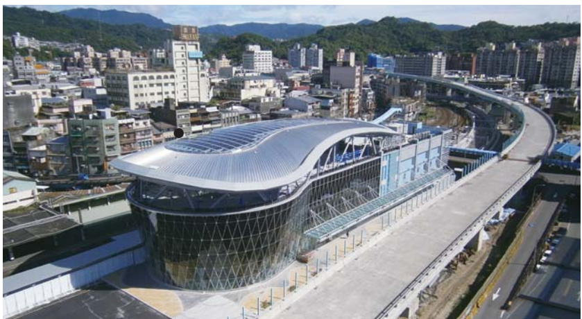
● 基隆車站南站遠景照