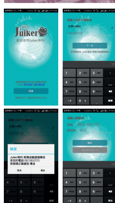
圖 1 首次登入揪科

揪科會員主要可分為三類：綠色會員、銀色會員及金色會員。綠色會員僅須下載 Juiker 應用程式並註冊成功即