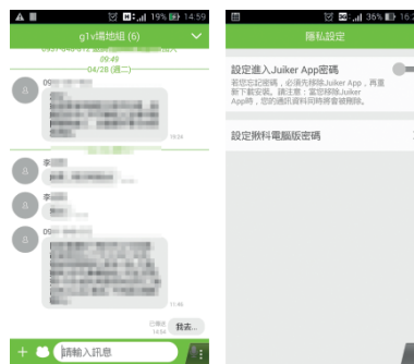
圖 7 設定揪科電腦版密碼