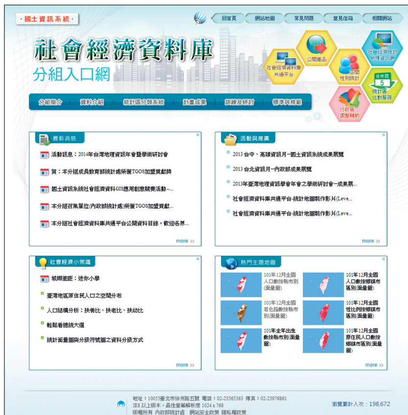
圖 3 國土資訊系統社會經濟資料庫分組入口網

為促進縣市統計資料空間化，於 102 年開始辦理補助地方政府建置國土資訊系統社會經濟資料庫作業，當年度計畫總預算經費 1,300 萬元，計有