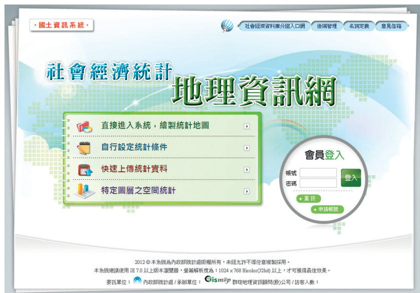
圖 2 國土資訊系統社會經濟統計地理資訊網