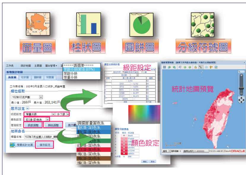
圖 4 國土資訊系統社會經濟資料庫共通平台地圖展示圖台

行政院張政務委員善政於 103 年 1 月 3 日「最小統計區開放資料 (Open Data) 執行成果報告」會議決議指示「內政部統計處所介紹的最小統計區，是政府資料去除個資的良好工具，簡報建議優先上架的資料，請相關部會配合；而最小統計區的使用，原則上請各部會都導入」。為建立國土資訊系統空間化及流通共享機制，及協助我國 OPEN DATA 之推動，將規劃推動中央機關建有統一收納系統之資料庫如財政部財稅資料、經濟部工商資料、行政院主計總處普查資料、中央健康保險署健保資料及內政部警政署警政資料等優先上架，並積極輔導地方政府建置地方分資料庫，以期各單位的行政區統計資料與統計區統計資料，整合於社會經濟資料庫共通平台，達流通共享的目標。❖