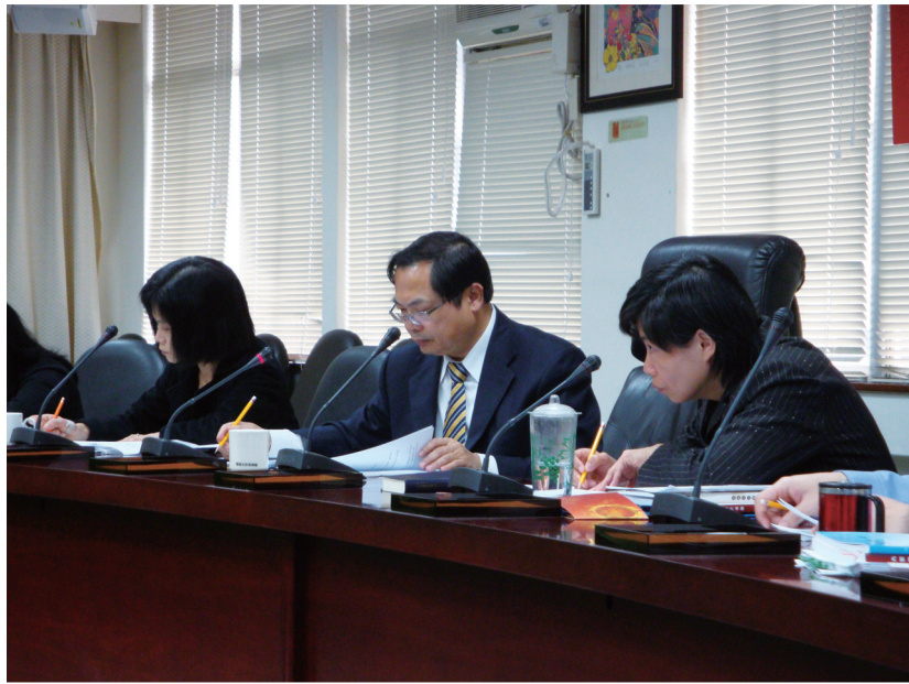
● 行政院內部控制推動及督導小組會前會開會情形

目前國內政府機關並未單獨設置稽核單位或稽核人員；由於兩者功能與內涵不盡相同，會計人員執行內部審核工作，並不能完全取代稽核人員之稽核業務。為期發揮 Y 機關稽核職能，並依獨立性及專業性考量，宜由該機關政風單位擔任。至其他公務機關在暫不考量審計機關辦理稽核工作之原則下，仍宜由政風單位掌理稽核業務，上述研析實可作為行政院研究發展考核委員會納入考量重點。